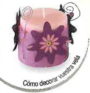
Cómo decorar vuestra vela